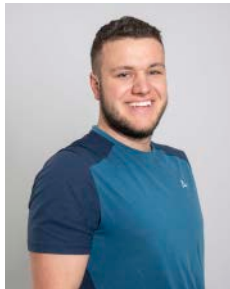
Präsident Remo Höpli