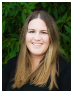
Aktuariat Nadine Moser